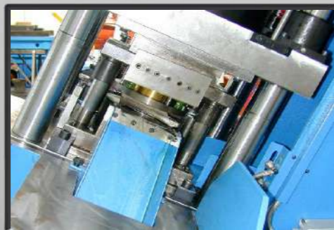
Portastampi e kit di imbutitura