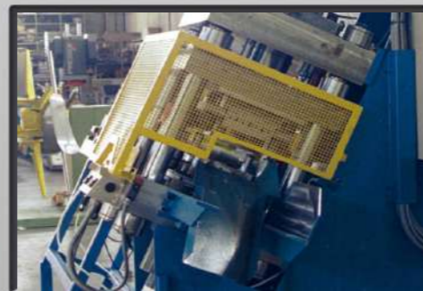
Protezioni su pressa