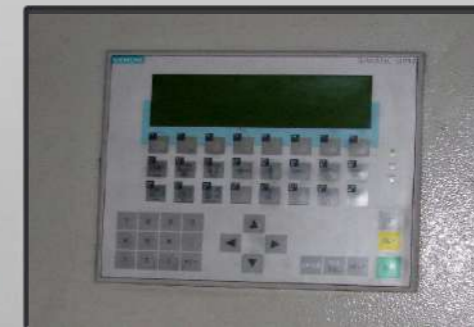
Pannello di controllo