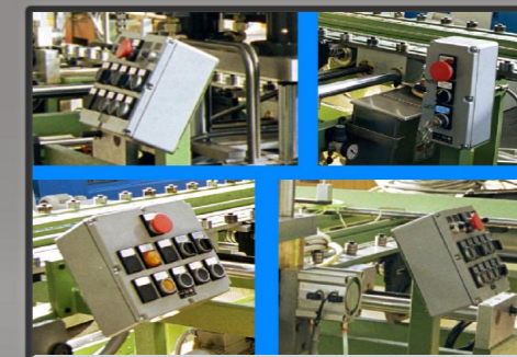
Pannelli di controllo