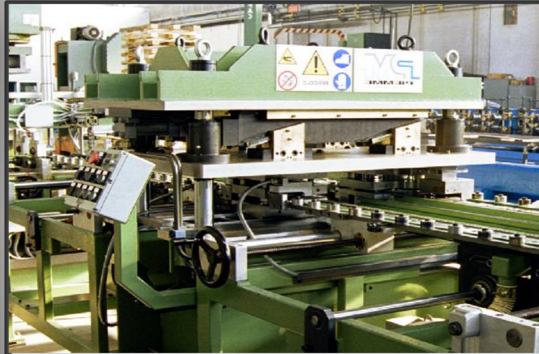
Banco di scantonatura e foratura

Linea con partenza da fogli tagliati già spianati. Alimentatore da foglio a ventose di testa con separatori magnetici e sensore per doppio foglio (possibilità di avere doppio caricatore). Banco di scantonatura punzonatura idraulica. Profilatrice a spalla mobile motorizzata con dispositivo di avanzamento lamiera motorizzato a catena per esecuzione della piega parallela. Trasportatore motorizzato magnetico, dopo profilatrice, con dispositivo di centraggio sulla piegatrice di testa.