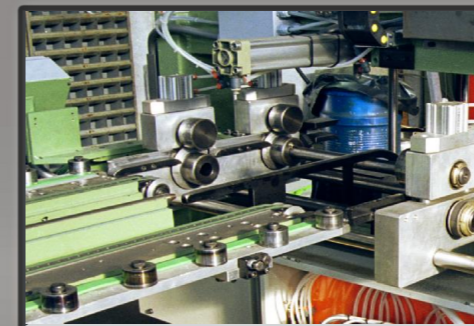
Dettaglio nastro trasportatore