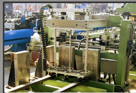
Caricatore a ventosa