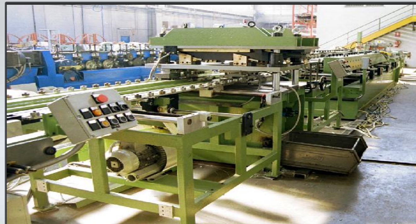
Vista di assieme linea